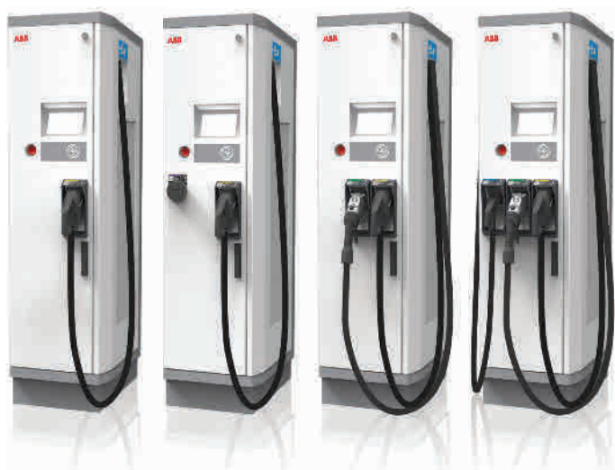
Lehetséges konfigurációk (balról jobbra): Terra 53 C, Terra 53 CT, Terra 53 CJ, Terra 53 CJG